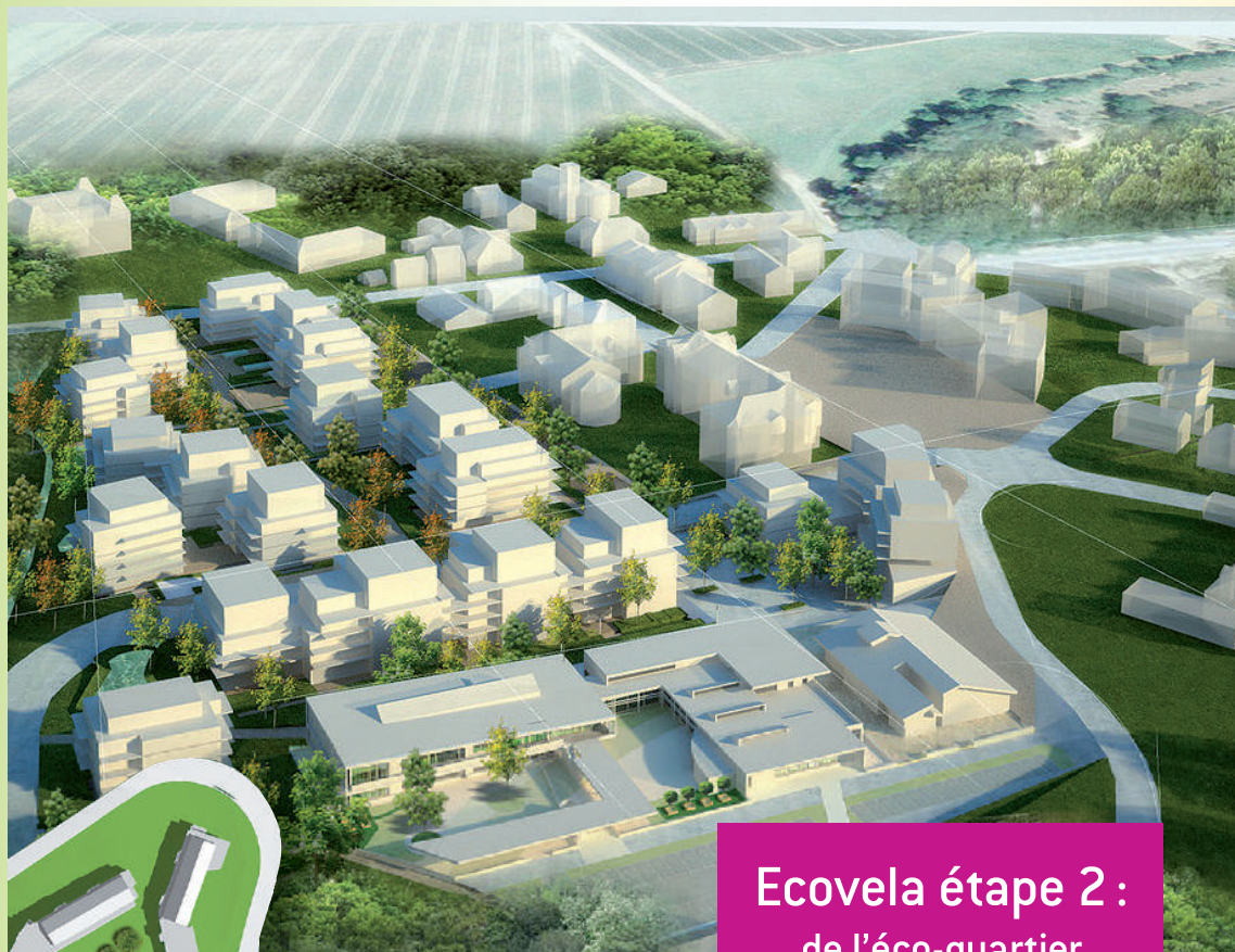
Ecovela étape 2 : de l'éco-quartier à l'éco-bourg