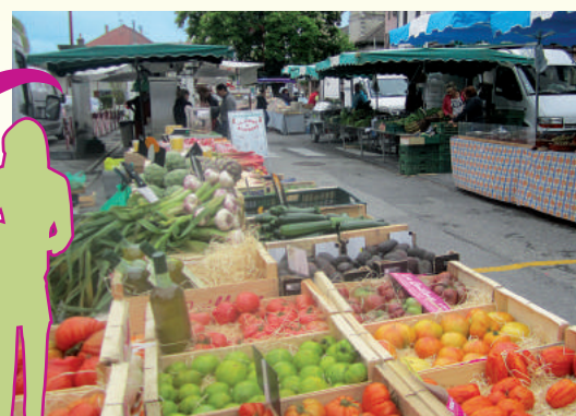
Le marché du samedi matin se déplacera de la rue du Marronnier vers la place centrale.